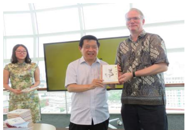
（《新洲雅苑》新书发布会现场）