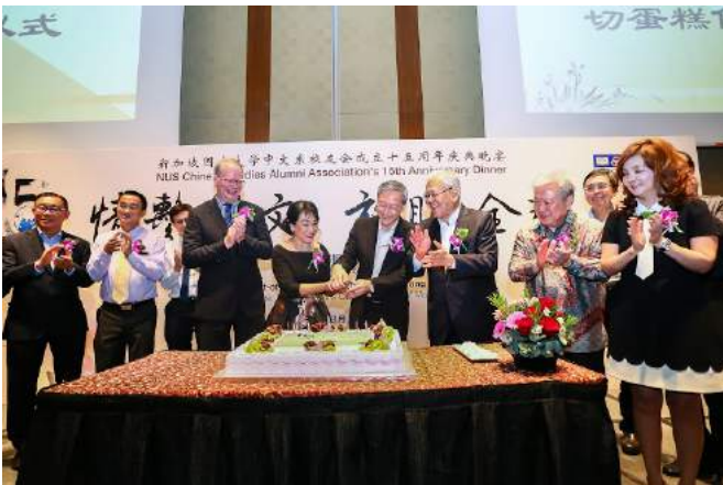
(庆典晚宴切蛋糕仪式)

当天晚上，校友会也于国大协会肯特岗会所宴会厅举办十五周年庆典晚宴，晚宴主宾为总理公署兼人力部政务部长 陈振泉 先生。多位名誉会长包括 傅春安 先生、 吴一贤 先生、 高允裕 先生及刚刚受邀成为名誉会长的 胡秀根 女士也都出席晚宴，与约 300 多位校友、各界人士一起共同欢庆校友会的生日，大家在愉快的气氛中欣赏节目、享用美食、回顾过去、尽情畅谈。晚宴当晚也举行了龙溪会馆教育基金捐助“国大中文系研究生奖学金”签约仪式。最后，晚宴在大家依依不舍的道别声中圆满结束。