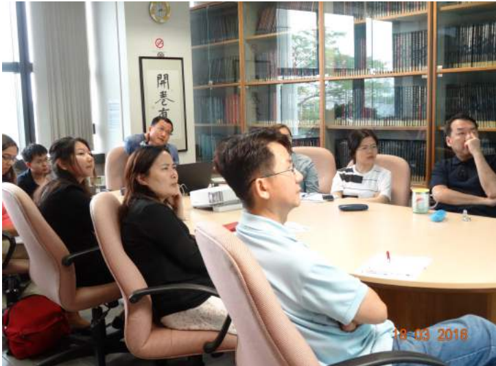
(许维贤博士讲座现场)

讲题为〈从华人身份认同的转变看新加坡和中国的互动：峇峇华人和猪仔、英籍华人和新客、本地人和新移民〉。