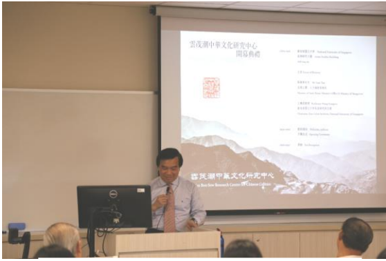
(李焯然老师在开幕式上致词)