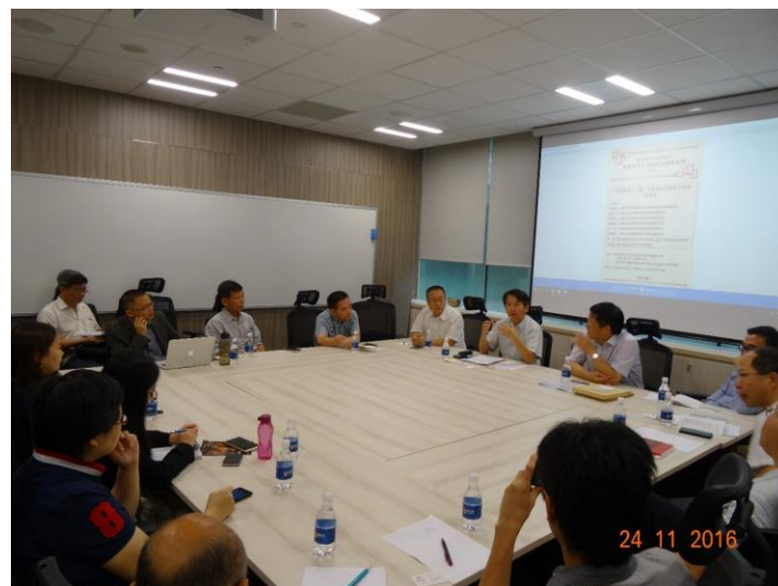
(“中国抗战与东南亚民族独立运动”座谈会现场)