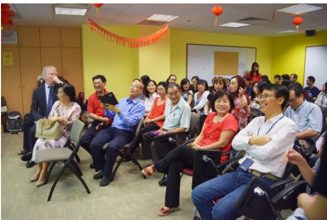
中文系师生济济一堂