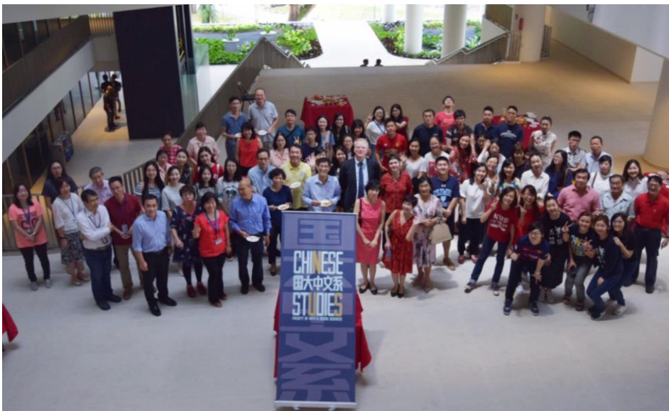
中文系师生大合照

会后宾客移步至新教学楼 AS8, 共捞鱼生, 享用茶点, 合影留念。(文: 安诗一)