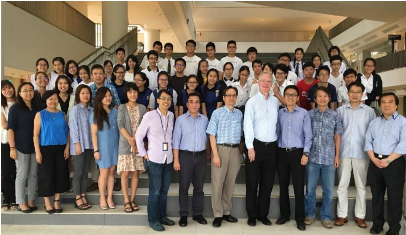
学术幼苗计划启始仪式全体照