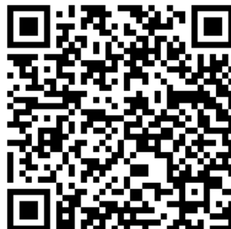
图片说明：祝福视频 QR Code