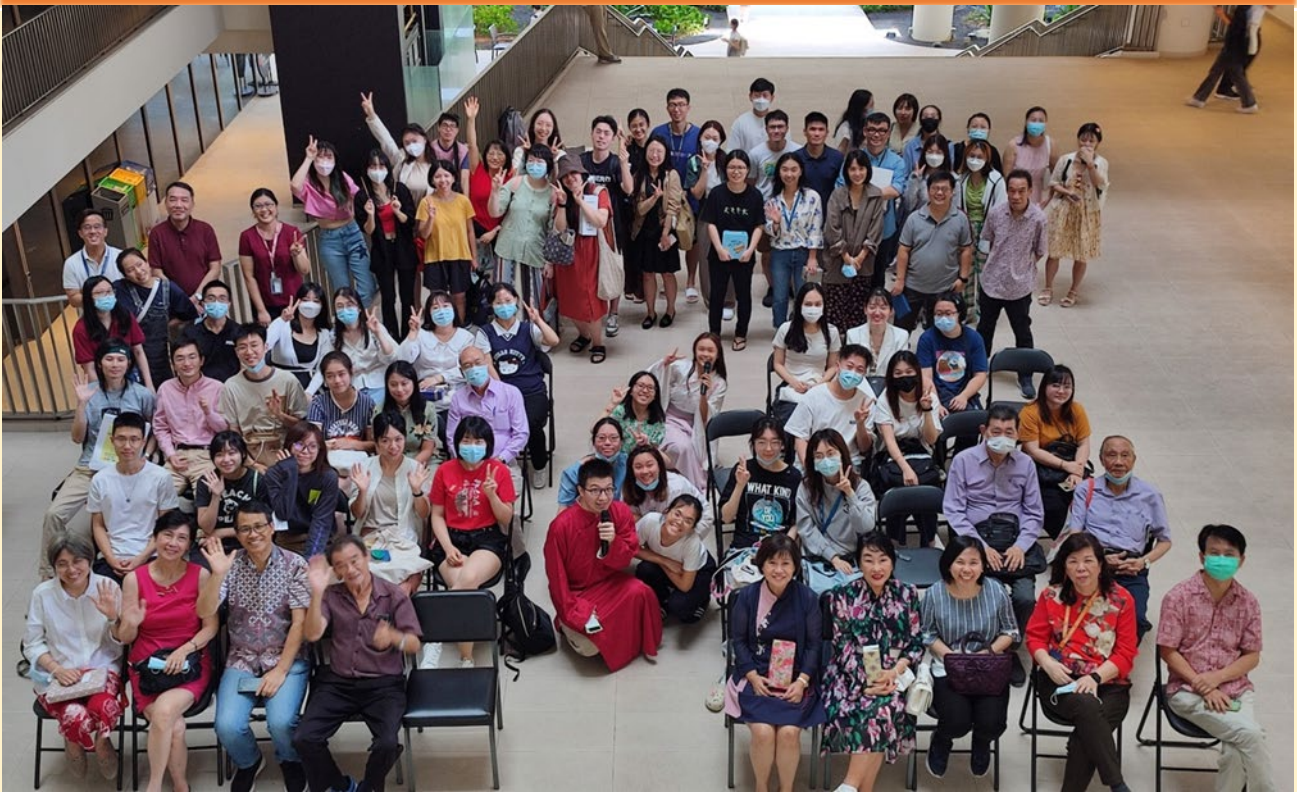
中文系新年团拜合影 (详见第 3-4 版)