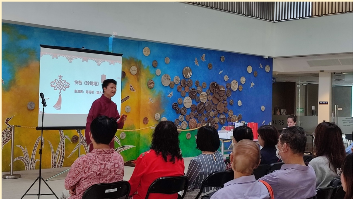
(左上图：歌曲表演；右上图：书法摊位；下图：快板表演)