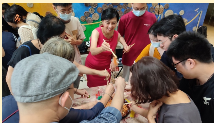
（左图：刺激的游戏环节；右图：捞鱼生）