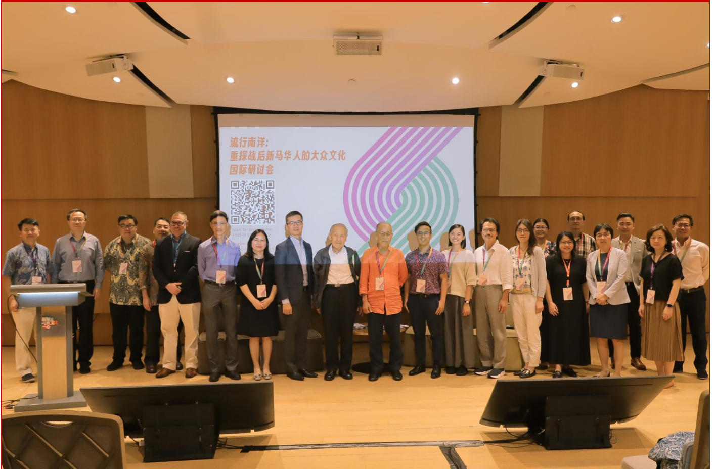
图片说明：“流行南洋：重探战后新马华人的大众文化”国际研讨会的大合照。

2023 年第 11 期 (总第 211 期) 2023 年 11 月 15 日