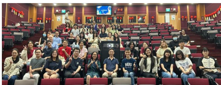
图3：中秋晚会大合照