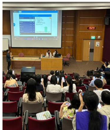
图2：抢答竞赛场面