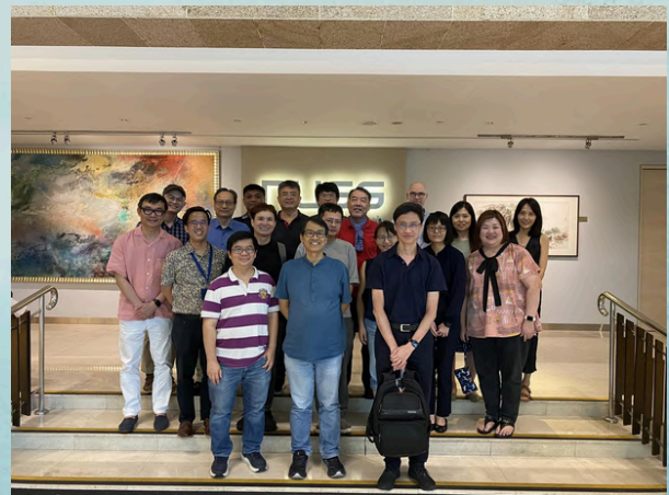
我系老师与劳悦强老师合影