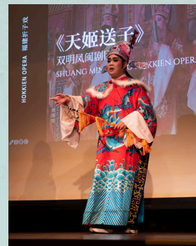
闽剧《天姬送子》。