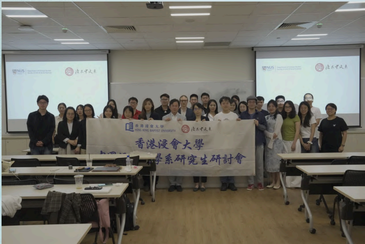
香港浸会大学、新加坡国立大学中文系研究生联合学术研讨会 第二天与会师生合照。