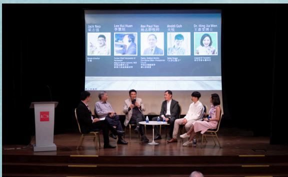
圆桌讨论。