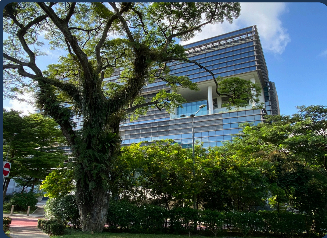
新加坡国立大学风景：AS8教学楼