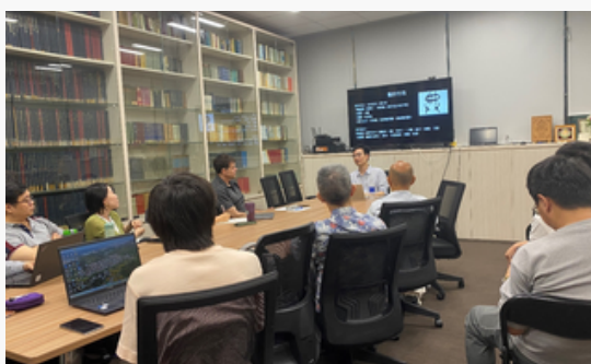
郑伊凡 博士讲座现场

澳门大学教育学院 谢琴 教授（A/P Qin Xie）于10月18日上午在线上进行学术讲座，讲题为：“Washback Studies in Asia Higher Education: Current Status and Future Directions”。