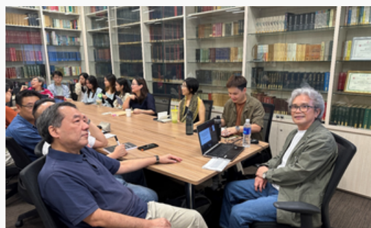
傅葆石 教授讲座现场

本系博士后 田源 博士于10月25日下午在雲茂潮中华文化研究中心（AS8-05-49）进行学术讲座，讲题为：“‘共生’：晚清重庆猪鬃出口贸易中的商业纠纷、地区冲突与治外法权（1890-1911）”。