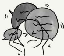
听到声音， 噪音，说话声

您可能听到一种或多种声音的经历。有一些声音是您能识别的，而有一些则是您无法识别的，不熟悉的声音。这些声音可能正在呼唤您的名字或正在与您交谈，或者可能是它们彼此之间相互交谈的声音。这些声音听起来可能是友善的或令人讨厌的。您也可能觉得它们对您有帮助或者令您感到恐惧。