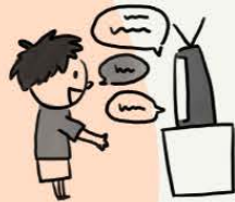
具有关联性的想法

您可能有一种信念或观念，认为其他人可以听到或看穿您的思想。有时您可能会认为自己的情绪和行为可能受到其他人的控制。