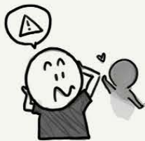
具有多疑的 想法和观念

您可能有一种信念或观念，认为其他人或组织正在观察，跟踪或计划伤害您。您也可能会怀疑您的家人或周围其他人，这使得您感到非常痛苦。