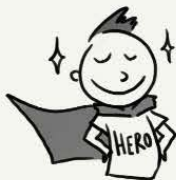
具有自己拥有特殊 宗旨或使命的想法

您可能有一种信念或观念，认为其他人可以听到或看穿您的思想。有时您可能会认为自己的情绪和行为可能受到其他人的控制。