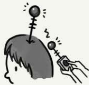
具有思维被广播或 被他人控制的想法

您可能有一种信念或观念，认为您在网上、电视、广播、或歌曲中所听到或看到的内容是直接针对您的。您可能认为它们正在向您发送特殊消息或正在与您交谈。