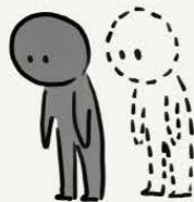
感觉与自己的 身份脱离

您可能有一种信念或观念，认为自己被选择执行一些特殊任务或完成某种使命。您也可能认为自己具有超自然的力量来完成使命。