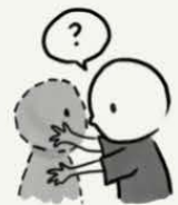
具有非寻常的 视觉体验

您可能有一种信念或观念，认为其他人或组织正在观察，跟踪或计划伤害您。您也可能会怀疑您的家人或周围其他人，这使得您感到非常痛苦。