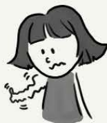
具有非寻常的嗅觉， 味觉，或触感体验

您可能感到与自己失去连接的经历，并且觉得不像您自己，或者感觉与自己的身体分离。您可能也觉得您的身体正在以一种难以解释的方式发生变化。